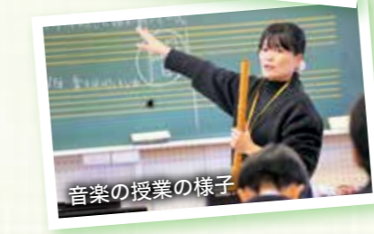
音楽の授業の様子